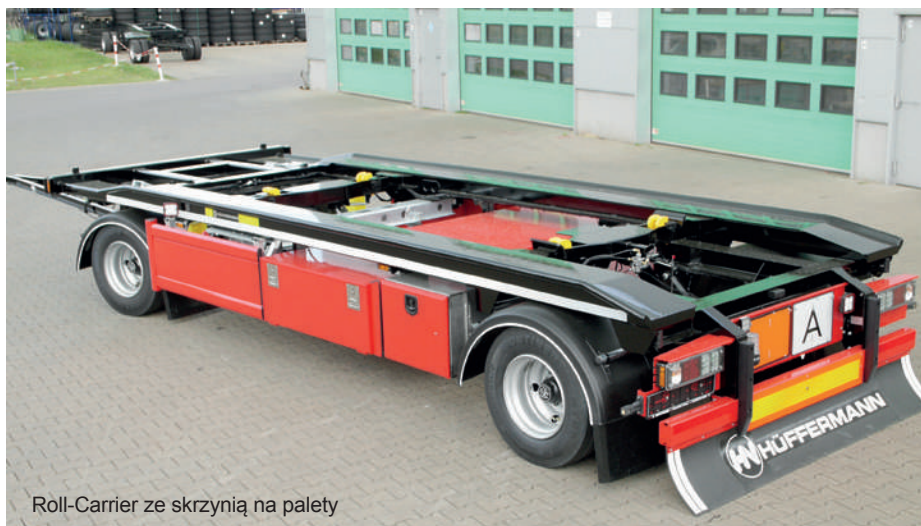
Roll-Carrier ze skrzynią na palety

Hüffermann wykorzystuje w produkcji tylko najwyższej klasy komponenty od renomowanych producentów, co procentuje długą żywotnością pojazdów przez cały okres eksploatacji. Skontaktuj się z nami, chętnie doradzimy!