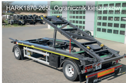
HARK1870-265L Ogranicznik kieszonkowy

Odpowiednie rozwiązanie do każdego zastosowania