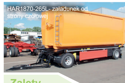
HAR1870-265L- załadunek od strony czołowej