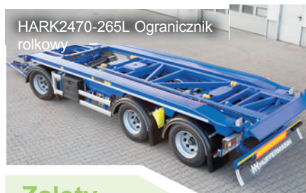
HARK2470-265L Ogranicznik rolkowy